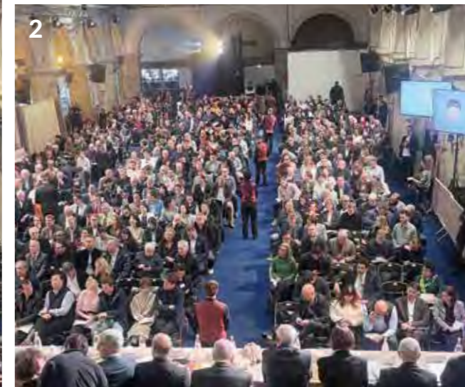
1 Blick in den Auktionsraum kurz vor Beginn: Reihenweise Stühle, Kamertechnik und letzte Vorbereitungen – hier wird die Bühne für die 165. Versteigerung der legendären Weine bereitet. 2 Der Saal ist gefüllt. Die internationalen Gäste verfolgen konzentriert jedes Gebot. 3 Das traditionsreiche Krankenhaus Hospices de Beaune: Gotische Architektur und bunt glasierte Ziegeldächer erinnern daran, dass hier seit dem 15. Jahrhundert Wein zugunsten wohltätiger Zwecke versteigert wird. 4 Lagekarte Frankreichs mit markiertem Beaune – im Herzen Burgunds gelegen.