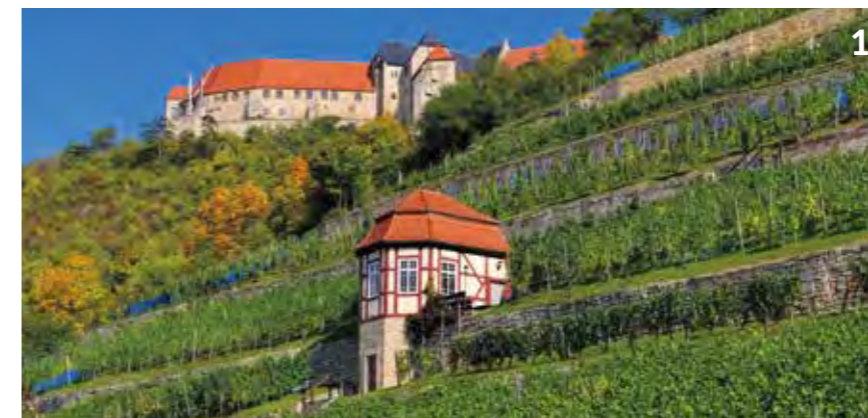
1 Herzoglicher Weinberg in Freyburg an der Unstrut. Einige der ältesten Reben stammen von 1925.